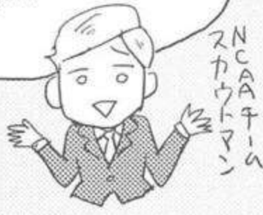
NCAAチア スカウトマン