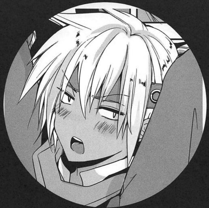
ナイトメア・キッド

リア充がデートなどしてる時間すべてゲーセンで w l wしてる彼氏いない歴=年齢 ちんちんが生えていることは誰にもいっていない