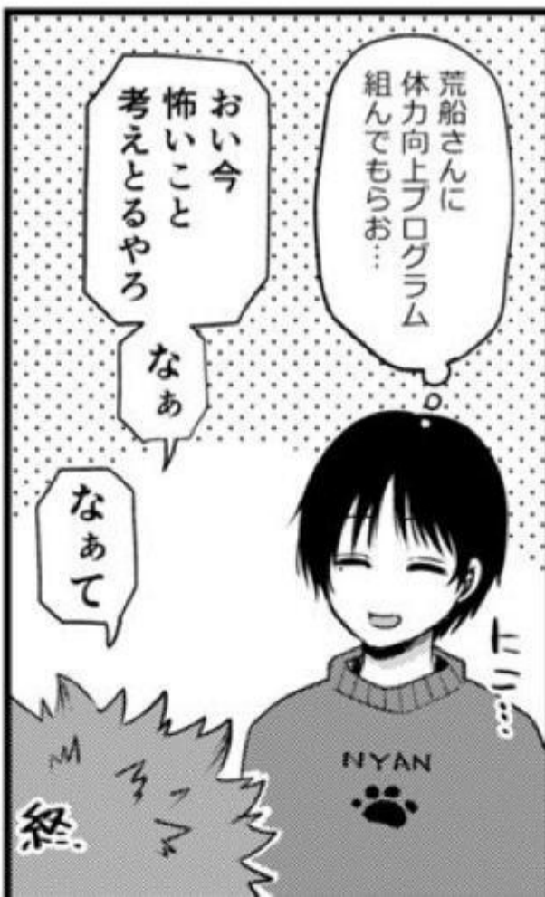
全身筋肉痛の水上の図