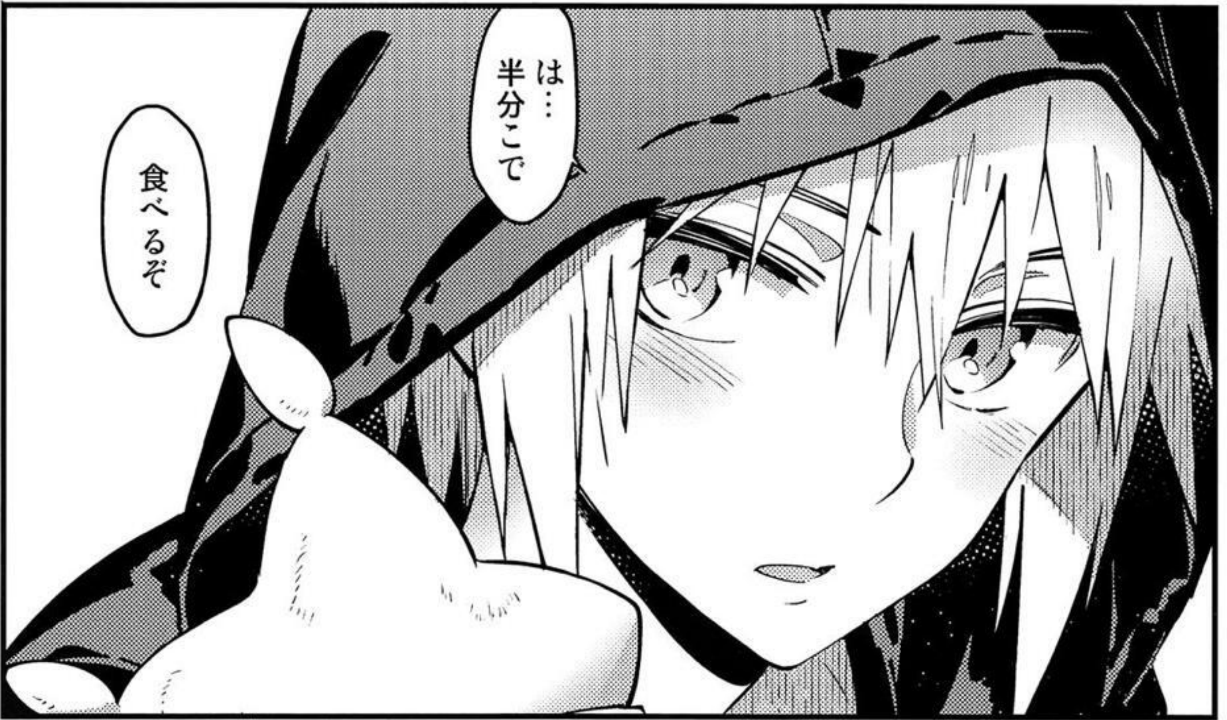
パオアの実まん(450円)