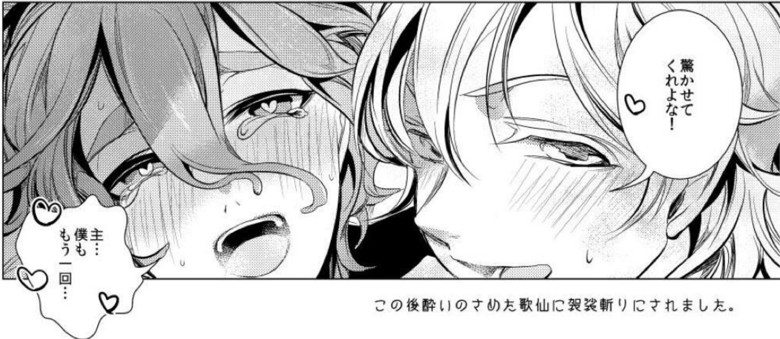
この後酔いのさめた歌仙に袈裟斬りにされました。