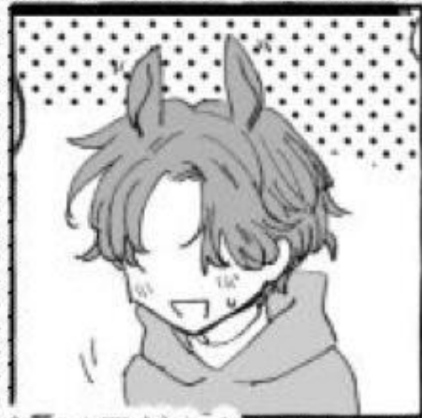
医療部モブオペレーター クランタ 馬なのでちんちんがでかいだって馬だから