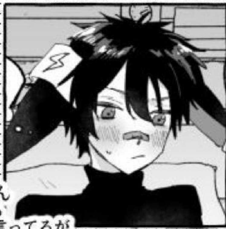
エアースカーペくん むっつりスケベびっち 気が向いた時だけと言ってるが 誘ったら割とエッチしてくれる

多忙に加え出会いも少ないロドス内では (特に内勤オペレーターの間では) 溜まった性欲を社内で発散するのは 割とよくあること という設定