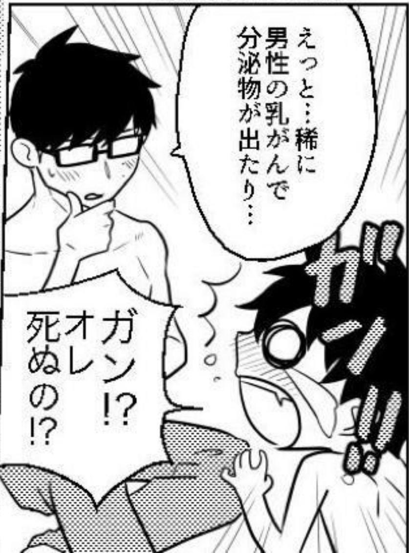
世界〇見えてやってたと思う