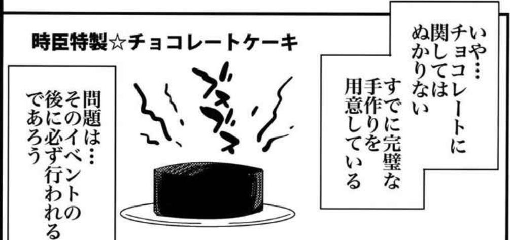
時臣特製☆チョコレートケーキ