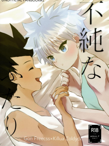
Gon Freecss×Killua Zoldyck