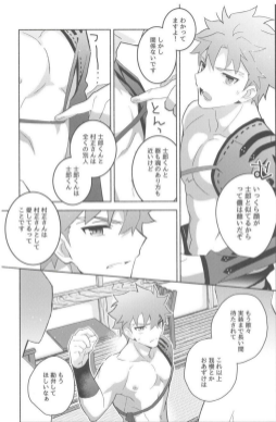
書いてるあいだに無事実演されました